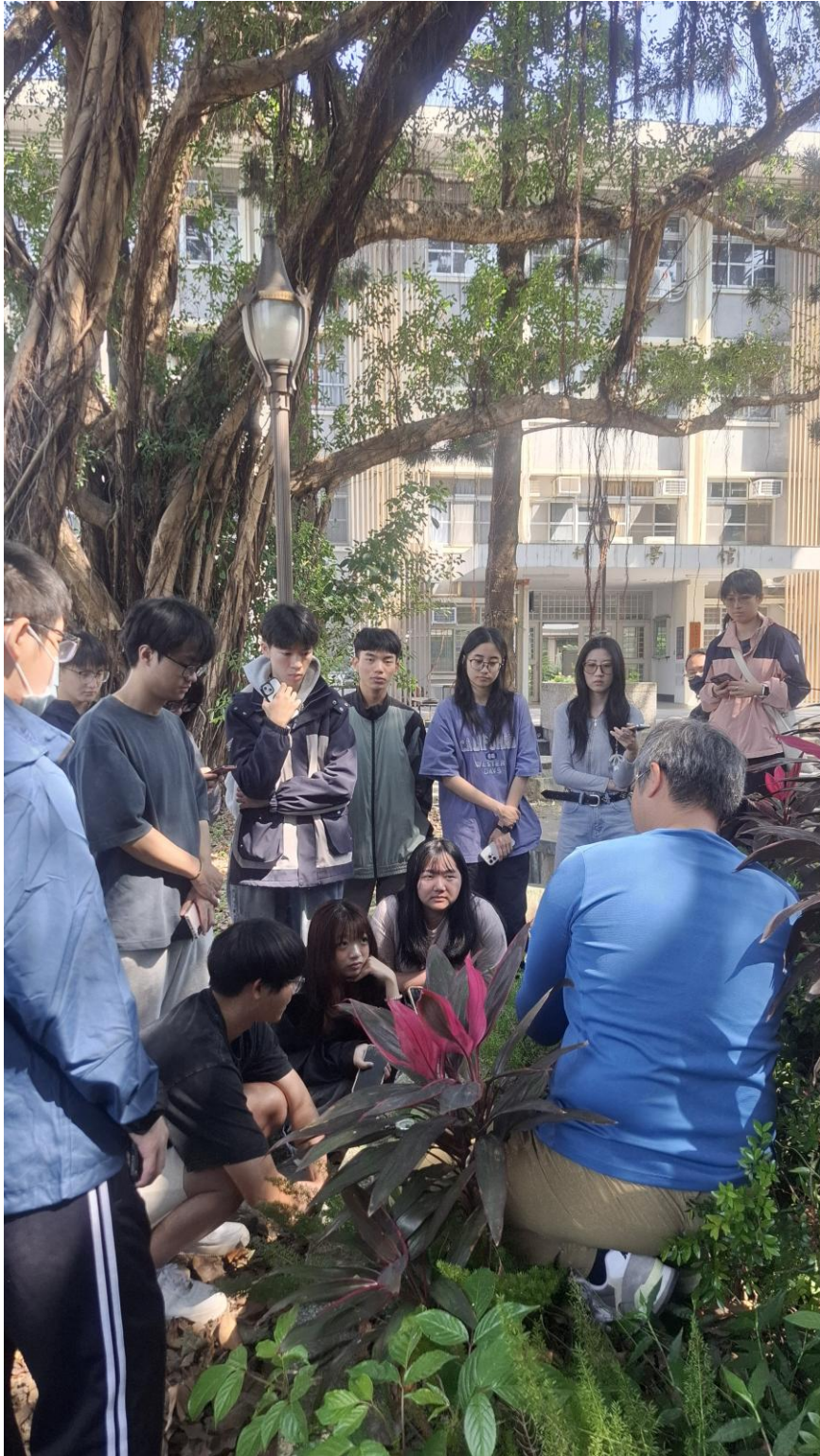
【照片記錄：儀器埋設、指北針校正與當下方位】